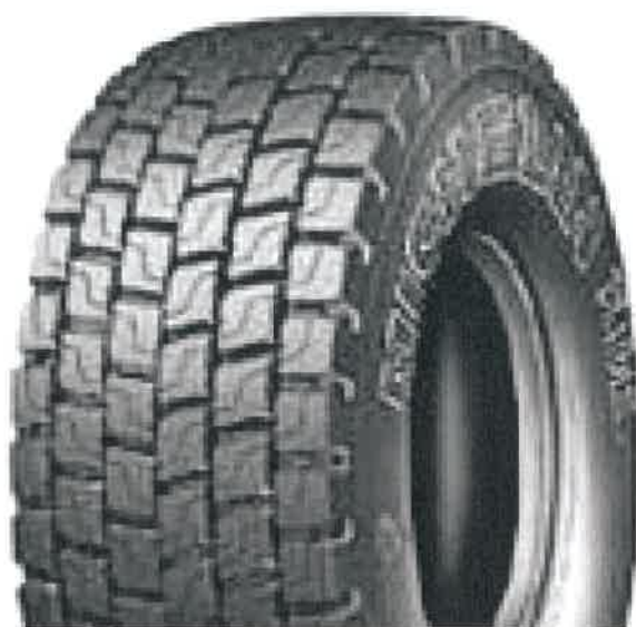
Michelin Remix XDE2 (Tabela 1, Lp.2,3,5,6,7)