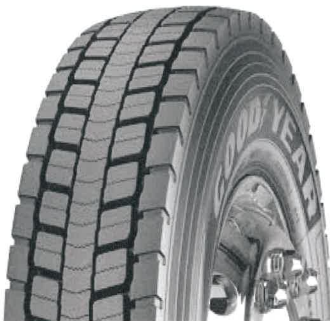
Goodyear Next Trade RHD II (Tabela 1, Lp.13, 18, 20)