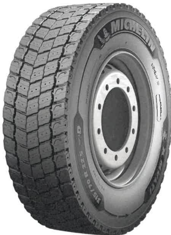
Michelin Remix X MULTI D TL (Tabela 1, Lp.8,9,10,15)