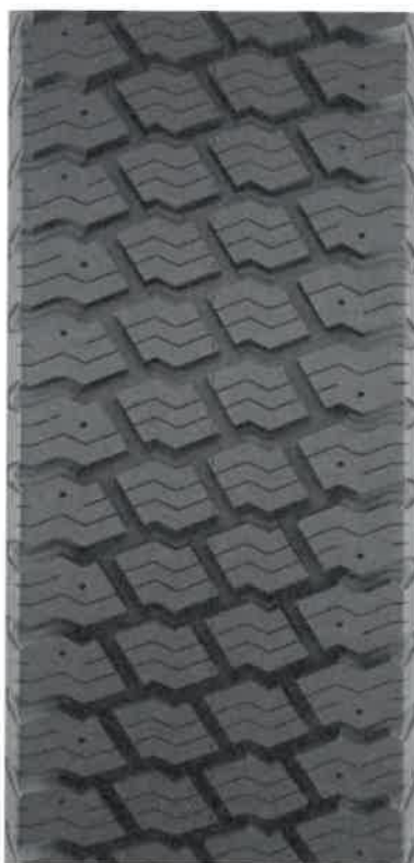
Bieżnikowana E23 (Tabela 1, Lp. 21,22,23)

Handwritten signature in blue ink: "Biller 10 mar 2024"