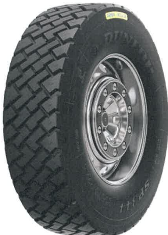
Opona bieżnikowana E-1 (Tabela 1, Lp. 4)