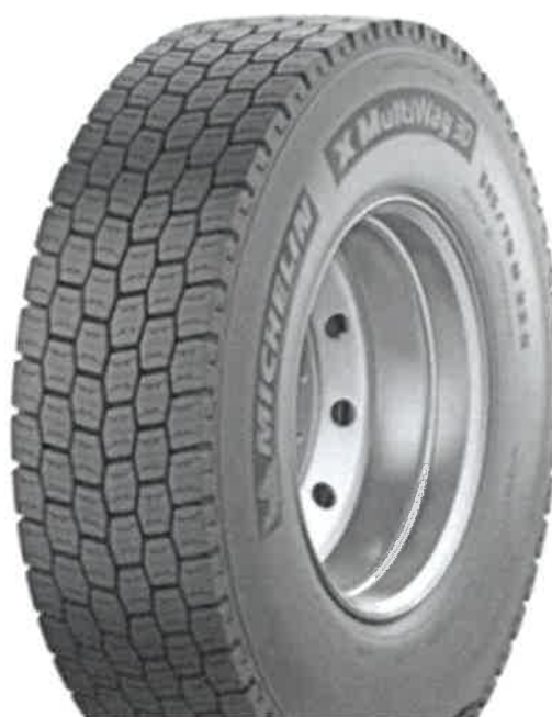
Michelin Remix X MULTI 3D XDE (Tabela 1, Lp.11)