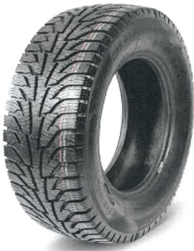
Bieżnikowana zimowa Gepard Snow Control (Tabela 1, Lp. 1)