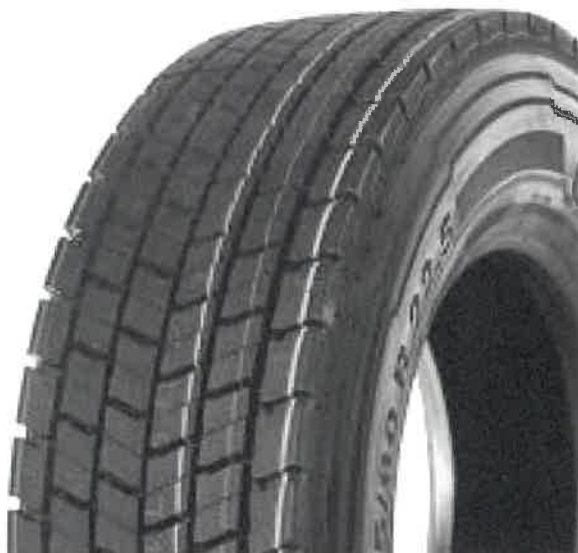
Continental ContiRe Hybrit (Tabela 1, Lp.17)