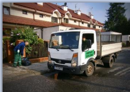
ODBIÓR ODPADÓW ZIELONYCH