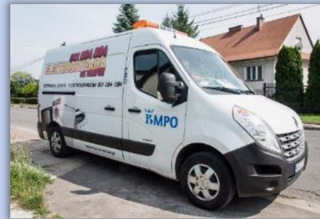
ELEKTROBRYGADA NA TELEFON