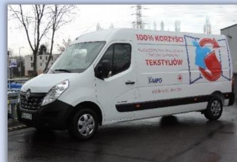
ODBIÓR NIEPOTRZEBNYCH TEKSTYLÓW