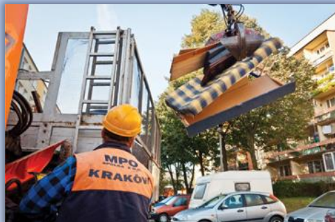
ODBIÓR ODPADÓW WIELKOGABARYTOWYCH