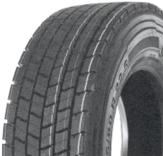
Continental ContiRe Hybrit (Tabela 2, Lp.17)