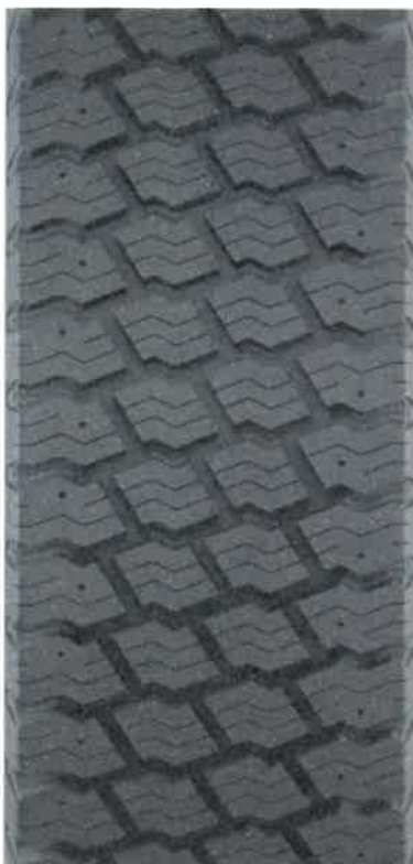
Bieżnikowana E23 (Tabela 2, Lp. 21,22,23)