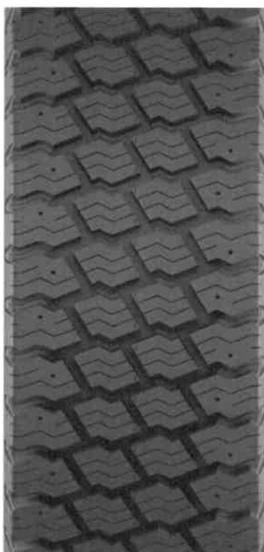
Bieżnikowana E23 (Tabela 2, Lp. 21,22,23)

Handwritten signature and initials at the bottom left of the page.