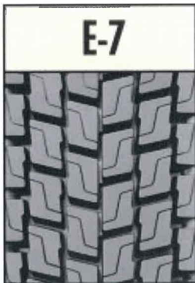
Bieżnikowa E-7 (XDE2) (Tabela 2, Lp.12,14,16,19,25)