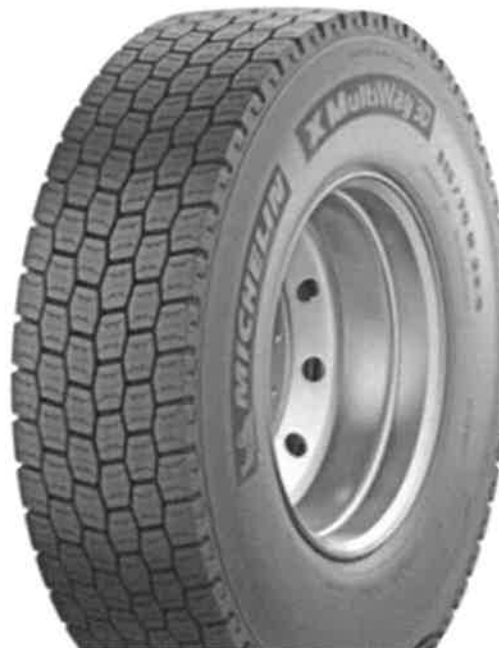
Michelin Remix X MULTI D TL (Tabela 2, Lp.11)