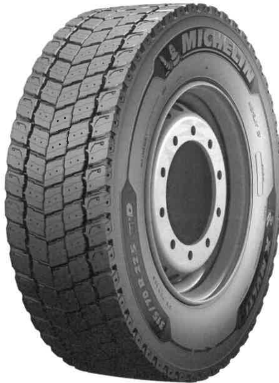
Michelin Remix X MULTI D TL (Tabela 2, Lp.8,9,10,15)