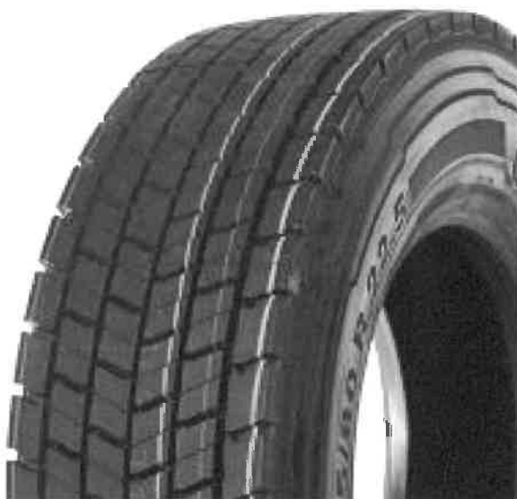
Continental ContiRe Hybrit (Tabela 2, Lp.17)